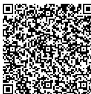
港澳地區報名及支付平臺