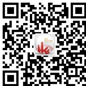
關注合唱節微信公眾號 瞭解合唱節後續內容