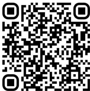
港澳地區組委會聯絡請掃碼